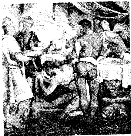
stětí Jana Křtitele (renesanční obraz)

Za historicky prvního křesťanského světce (mučedníka) je považován svatý Jan Křtitel (4 př.n.l. – 28 n.l.). Byl posledním starozákonním prorokem, i když jeho postava a činy byly zařazeny zcela logicky do biblických textů Nového Zákona (do evangelií Marka, Matouše, Lukáše a Jana). Narození Jana Křtitele katolická církev slaví 24. června. Stal se patronem Malty, Burgundska a Provence. Atributem sv. Jana