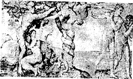
freska Michelangela ze Sixtinské kaple

Biblický příběh o Adamovi a Evě se stal inspirací pro celovečerní kreslený film Eduarda Hofmana Stvoření světa (1957) na základě ilustrací karikaturisty Jeana Effela. Nejznámější a nejslavnější podobiznou těchto prvních biblických postav jsou obraz od renesančního malíře Albrechta Dürera (z r. 1507) a Michelangelova freska Stvoření světa v Sixtinské kapli ve Vatikánu, kde se po úmrtí papeže koná konkláve (volba nového papeže).